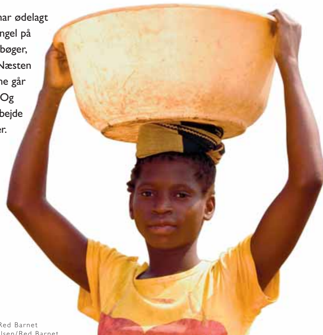
Tekst: Camilla Sieljaks/Red Barnet

40 års borgerkrig har ødelagt Angola. Der er mangel på alt. Skoler, lærere, bøger, blyanter og papir. Næsten halvdelen af børnene går stadig ikke i skole. Og dem der gør, må arbejde hårdt for at blive der.